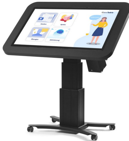
Care Table - Aktivitätstisch

Nachdem wir im Frühjahr den Care Table ausprobiert und Rückmeldungen gesammelt haben, wird dieser in den nächsten Wochen geliefert. Wir hoffen sehr, dass sie Freude daran haben.