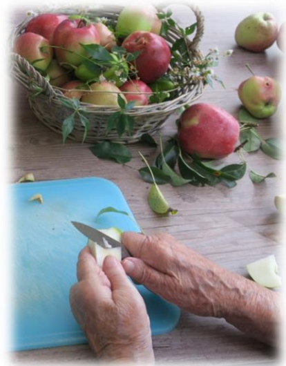
Apfelernte mit der Aktivierung

Unsere Angebote richten sich nach den Bedürfnissen und Fähigkeiten der einzelnen Teilnehmenden. Interessierte treffen sich regelmässig z.B. zum Werken, Kochen oder zum Gedächtnistraining. In offenen Gruppen nehmen sie am Singen, Literaturgruppe, Lottonachmittag, Turnen oder an Filmnachmittagen teil. Ein Aktivitätenplan ist zur Orientierung an diversen Orten angeschlagen. Für Bewohner/innen, die sich nicht in eine Gruppe integrieren können (Sprachprobleme, bettlägerig etc.), werden Einzeltherapien angeboten.