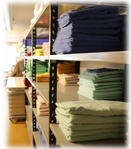
Blick in die Lingerie

Die Kleidungsstücke werden im Alterszentrum Mühlefeld gewaschen und gebügelt. Diese Dienstleistung ist in der Pensionstaxe enthalten. Wäsche und Kleider können auch bereits eine Woche vor Eintritt abgegeben werden.