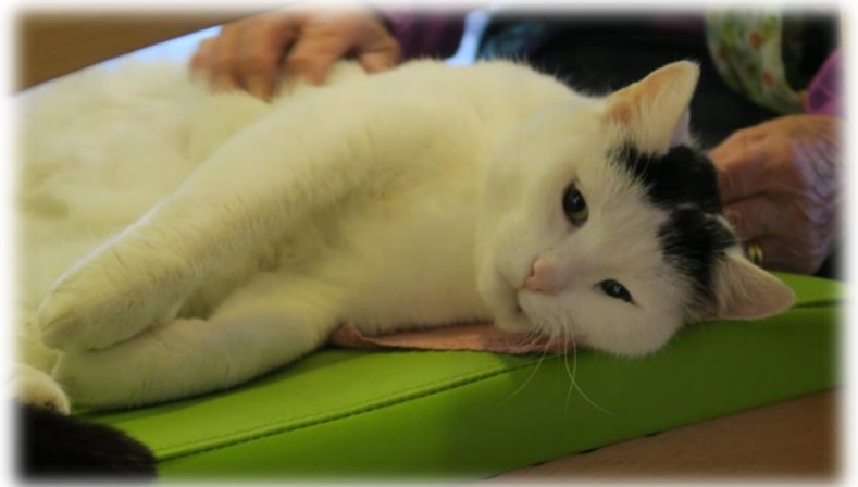
Unser Hauskater Simba

Das Halten von Tieren ist nur in Ausnahmefällen im Alterszentrum Mühlefeld und nur mit Bewilligung möglich. Haustiere müssen Sie selbständig füttern, pflegen und sauber halten. Die Tiere dürfen die anderen Bewohner nicht stören. Ebenfalls muss geregelt sein, wer nach dem Tod des Halters für das Tier verantwortlich ist. Falls die Geschäftsleitung eine Tierhaltung bewilligt, wird dazu eine Vereinbarung abgeschlossen.